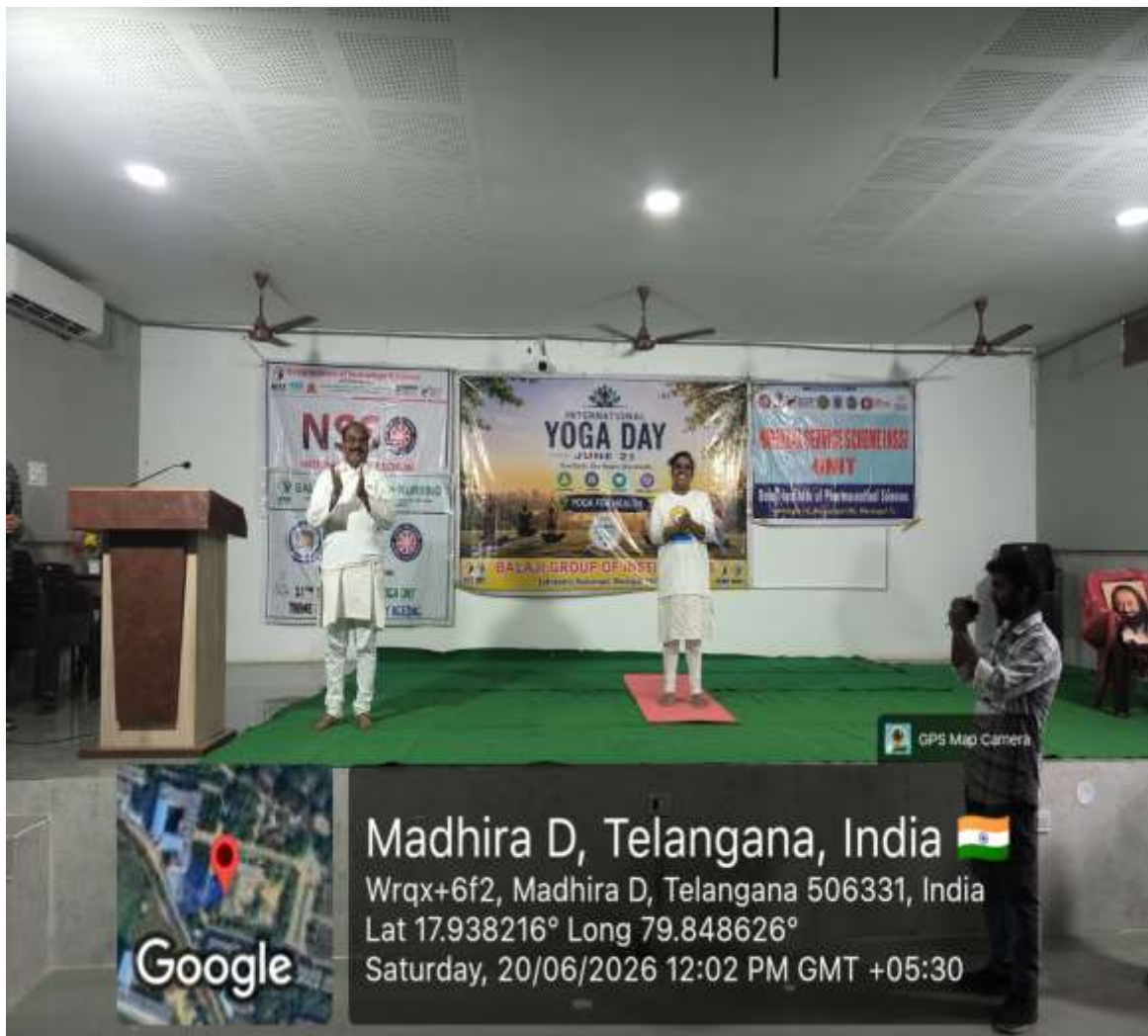
Explaining Yoga Asana to students