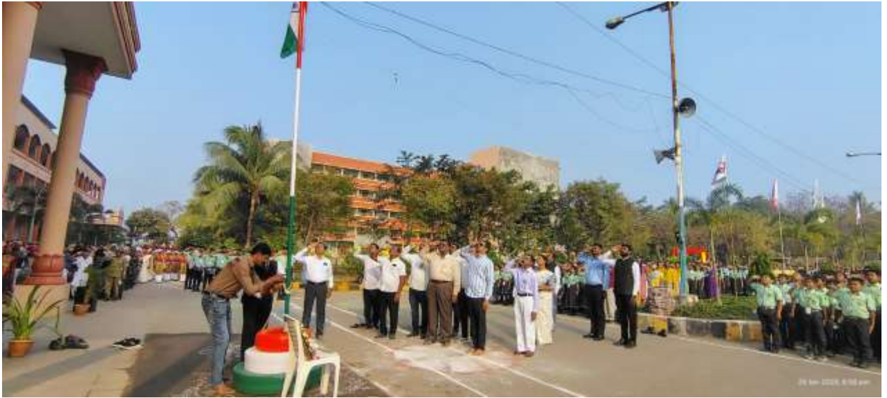
Salute to National flag