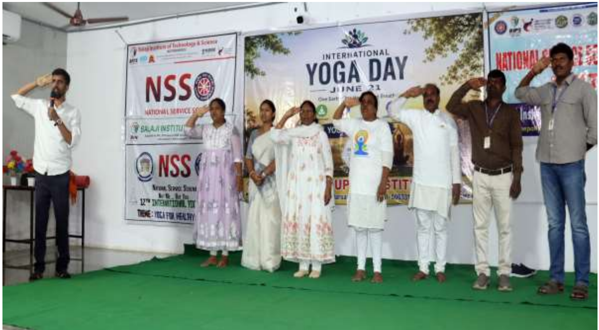
Salute to National Anthem