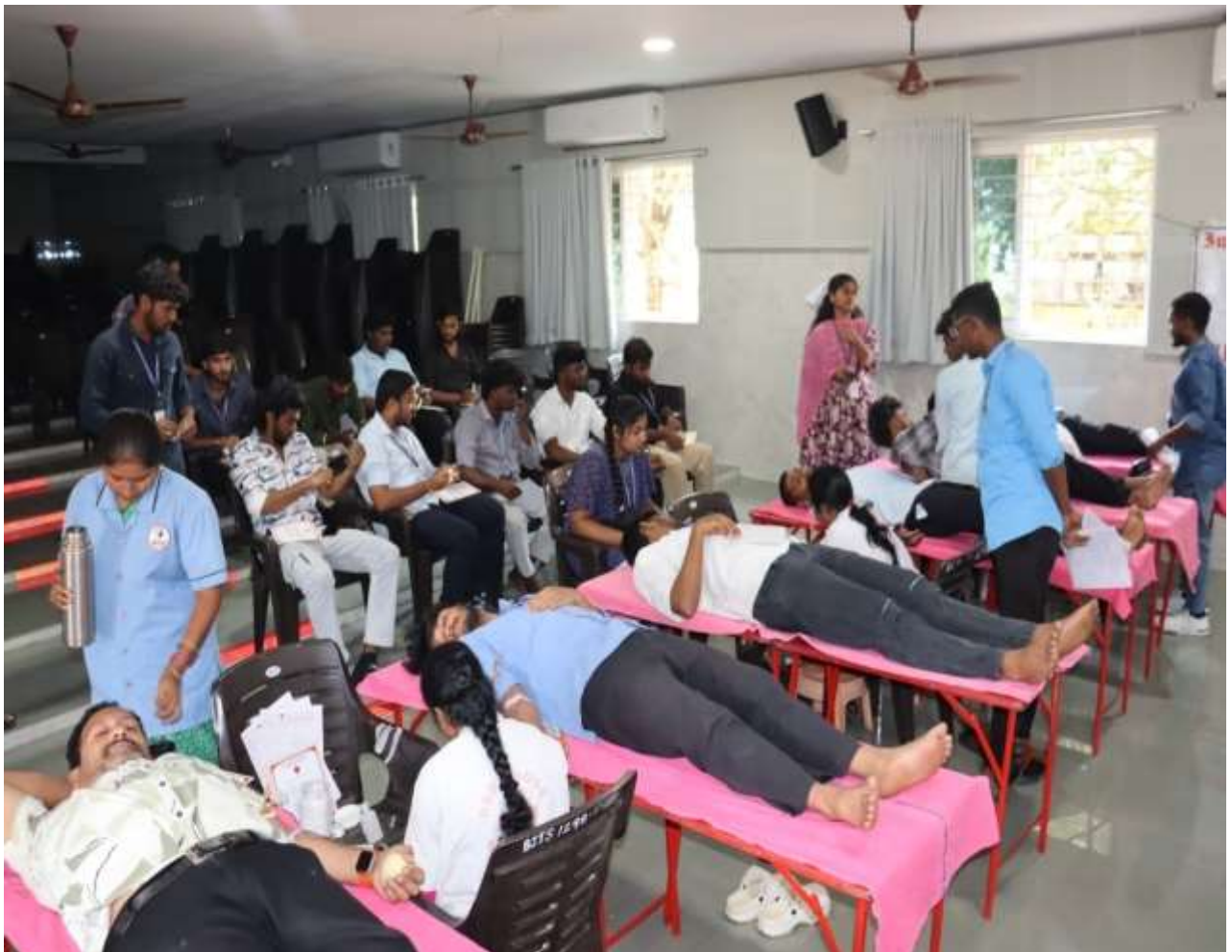
Blood Donation by students