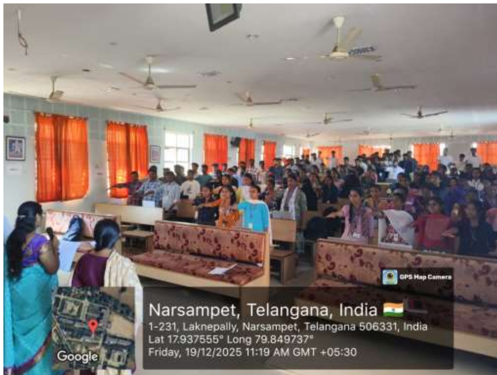
Cancer Prevention Pledge by staff and students