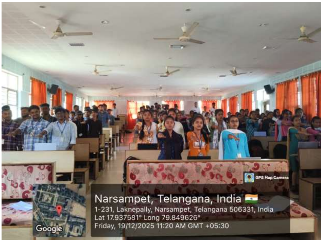
Cancer Prevention Pledge by students