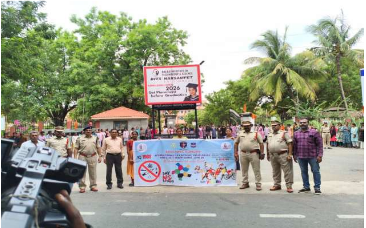
Addressing the students