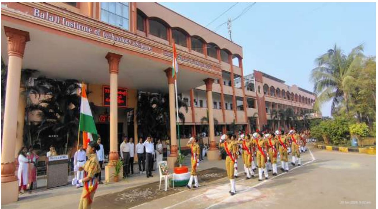
Salute to National flag with march past