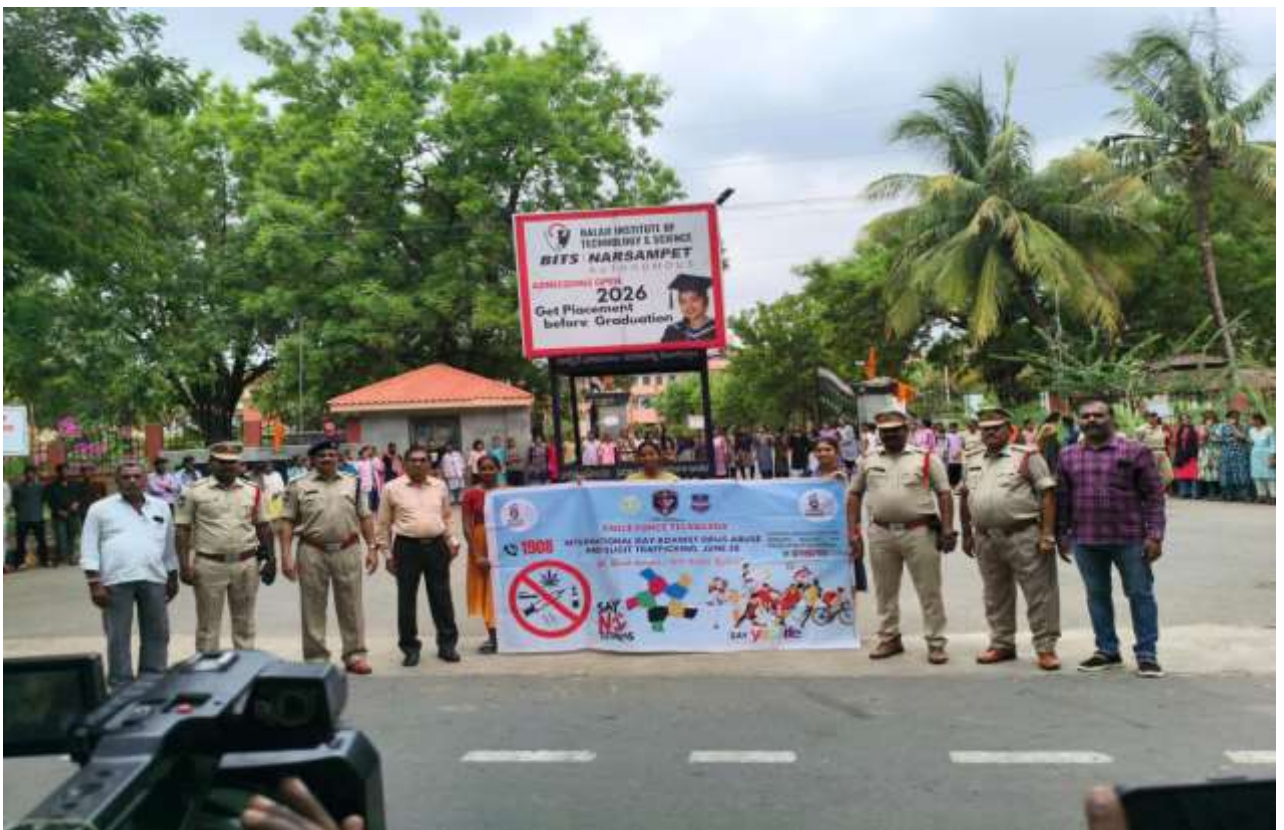
Addressing the students