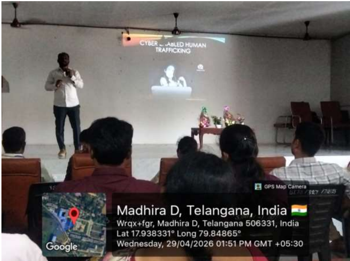
Talk on Cyber Enabled Human Trafficking