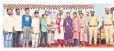
నెల్సోన్లో విద్యార్థులకు అపరాధం అందిస్తున్న పోలీసు అధికారులు