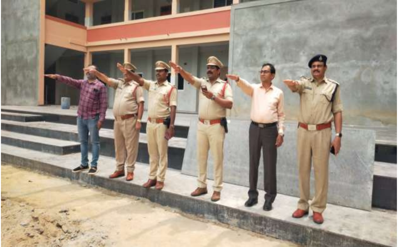
Pledge taking by speakers